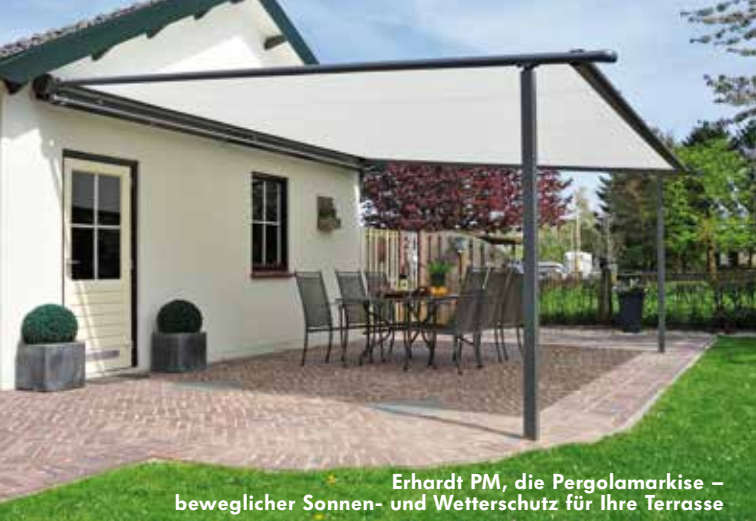
Erhardt PM, die Pergolamarkise – beweglicher Sonnen- und Wetterschutz für Ihre Terrasse